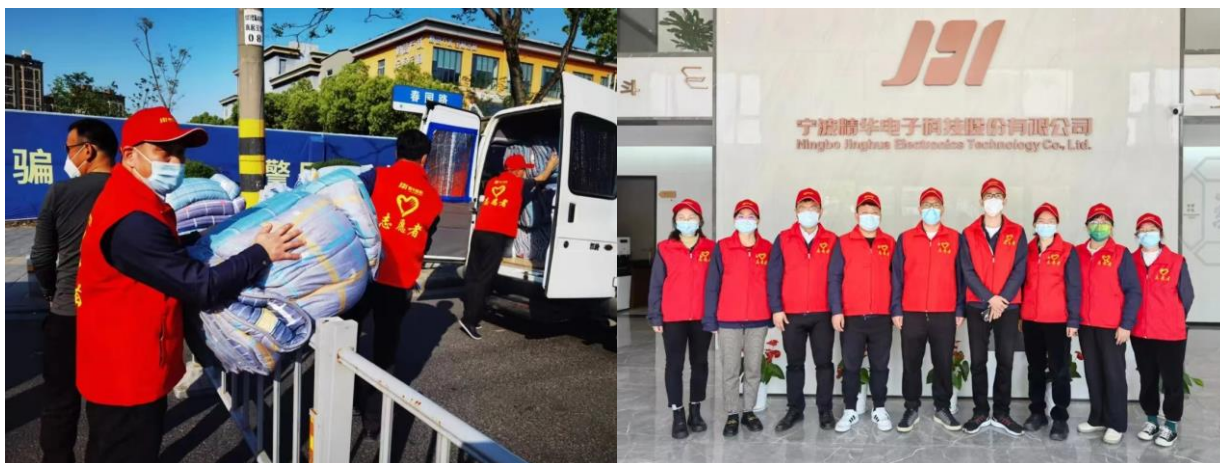
图表 5-1 疫情防控志愿者小分队

2020 年疫情伊始，公司便成立了疫情防控志愿者小分队，在保证公司正常生产经营的同时积极投入公司防疫和社区防疫工作，体现精华人勇于担当、义无反顾勇往直前的精神。