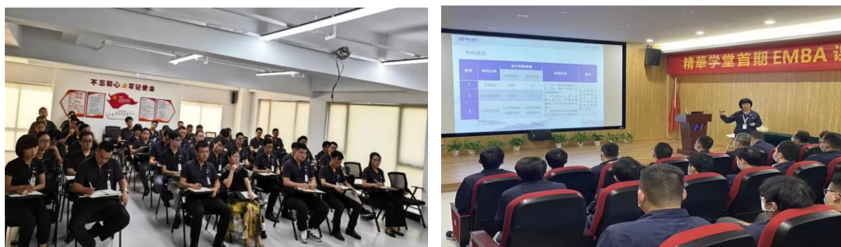
图表 1-2 公司企业文化宣贯大会

公司高层提供了通畅的员工沟通渠道，广泛听取各层面员工的意见或建议，保持组织内部沟通顺畅；通过展会、供应商大会、拜访等多种形式，听取顾客、供方等相关方的意见及建议。公司内部营造良好的沟通氛围，力求创建员工坦诚沟通的平台和环境，多渠道听取员工及其他相关方要求，实现不同部门、不同职位、不同地区间的有效沟通，如下图表所示。