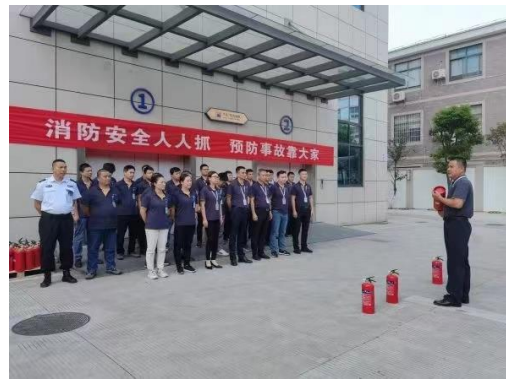
图表 4-6 消防知识培训及演练