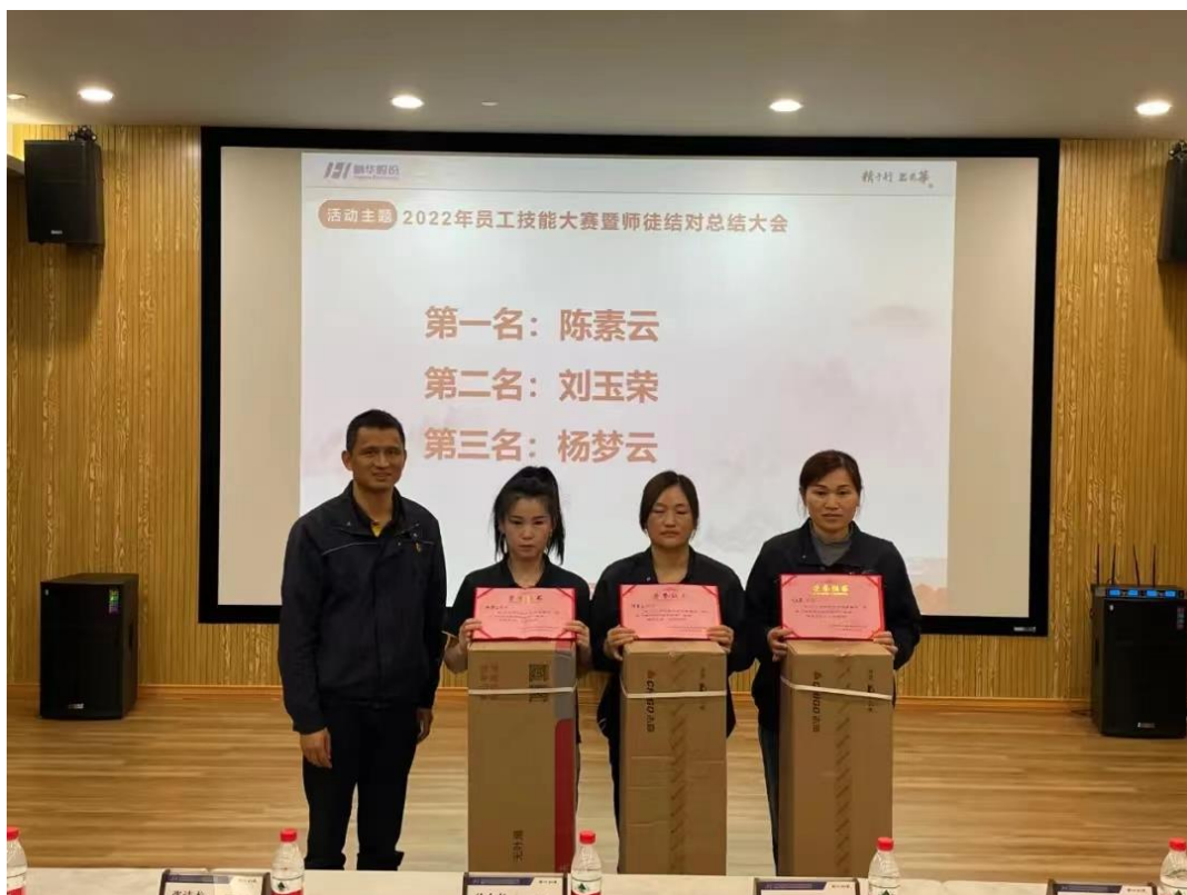
图表 1-5 技能比武大赛