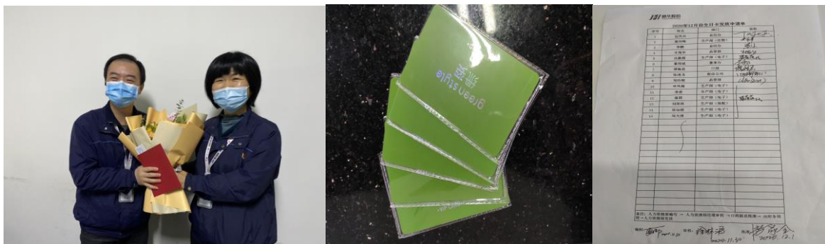
图表 4-2 员工生日卡、鲜花发放