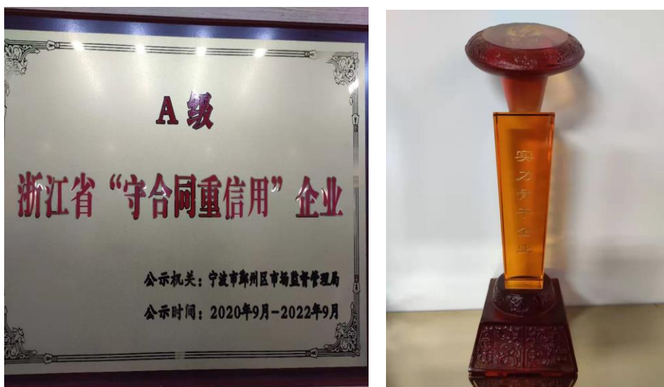
图表 3-4 “实力骨干企业”“浙江省守合同重信用企业”荣誉

公司以诚信为本与全体员工共同创造精华股份坚实的基业，提高企业内部管理水平和产品研发设计能力，公司不断开拓汽车大灯调光电机市场，扩大市场占有率，持续投入研发光电产品，拓展光电产品市场新领域。公司不断改造生产设备、打造国家级的实验室、进行精益生产的软件、硬件投入，开发新产品，不断扩展产品线，近年来陆续取得多项国家级、省级的发明专利和技术创新，获得良好的社会口碑。公司先后荣获 2018 宁波市“名牌产品”、“浙江省守合同重信用企业”、“实力骨干企业”等荣誉。