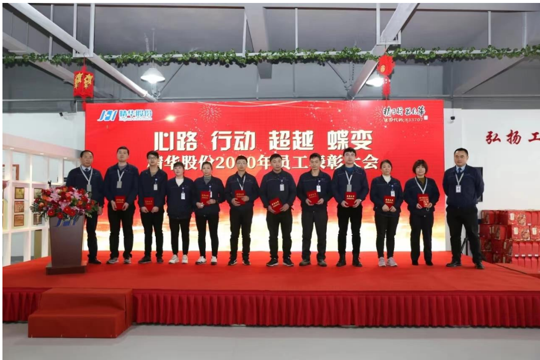
图表 1-4 公司年度表彰大会