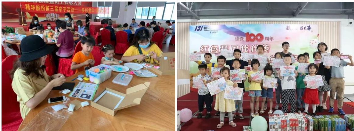
图表 4-3 员工亲子活动

公司为保证和不断改善员工的职业健康安全，针对不同的工作场所确定相应的测量指标和目标，公司识别了特殊工作场所的测量项目和测量指标见下表。