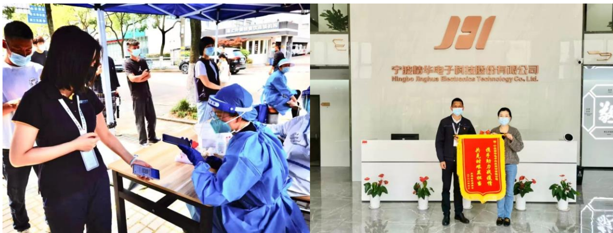
图表 5-2 社区疫情防控

2021 年公司与宁波市第二技师学院、四明职业中学、古林职业中学开展校企合作，创建研修基地给广大学生提供实习岗位，培养实操能力。